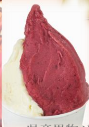
県産果物ジェラート