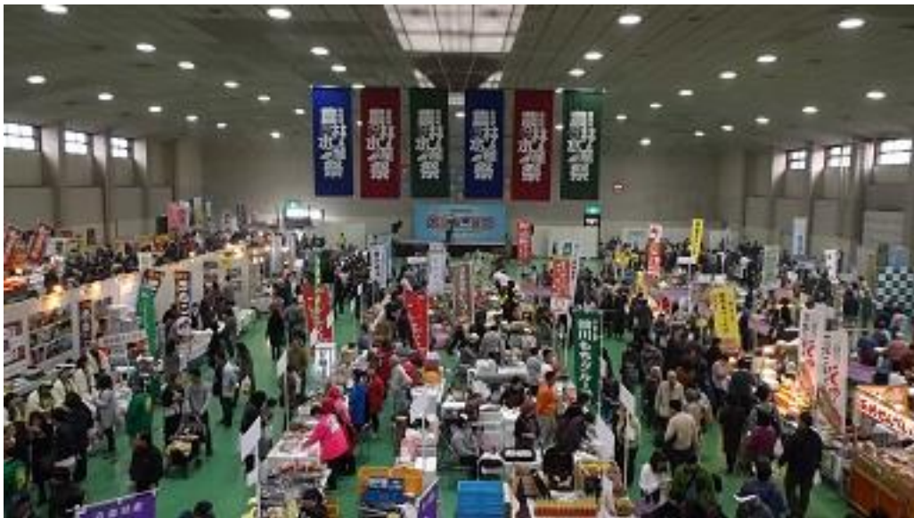
第10回 津軽海峡交流圏「大農林水産祭」の様子