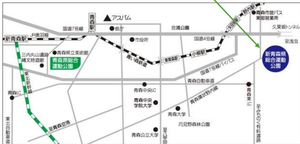
新青森県総合運動公園

■屋内は物産協会が一部管理運営（消防団関連店舗も出店） ■屋外は消防団関連団体が管理運営