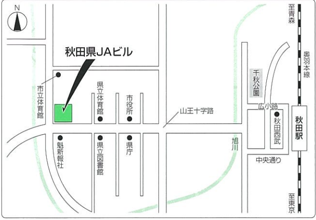
JR秋田駅西口からタクシーで約15分、秋田中央交通バス「山王交番前」バス停より徒歩2分

2018年6月22日(金) 13:30~15:30 秋田県JAビル 大ホール 〒010-0976 秋田県秋田市八橋南二丁目10番16号 TEL : 018-864-2055 URL : http://www.akita-jab.co.jp/